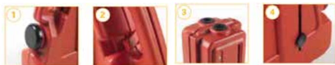
(1) Bocchettone per acqua (2) Bloccaggio per il trasporto (3) Sedi forate per inserimento cartelli o bulbi luminosi (4) Manopola di bloccaggio in estensione.